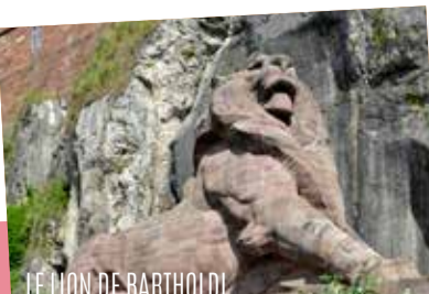
LE LION DE BARTHOLDI

28 TOUR 46 Elle abrite les expositions temporaires des Musées de Belfort.