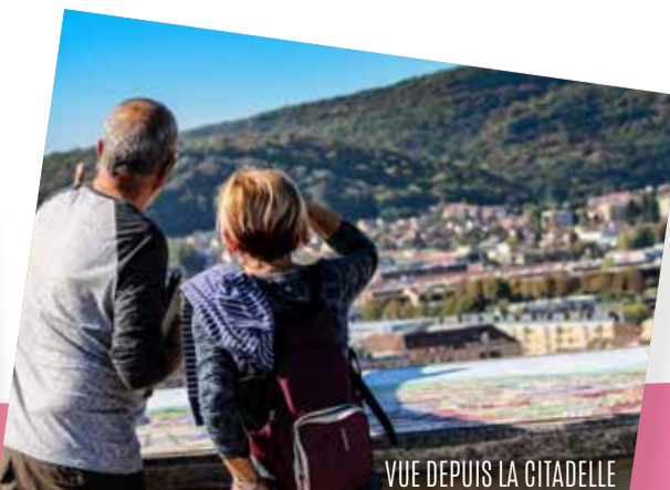
VUE DEPUIS LA CITADELLE