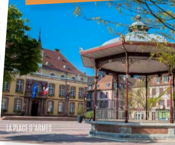
LA PLACE D'ARMES