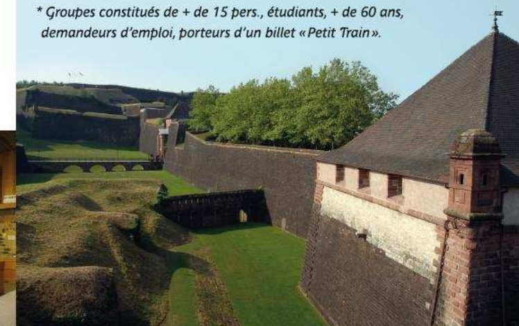
Le Musée d'Histoire